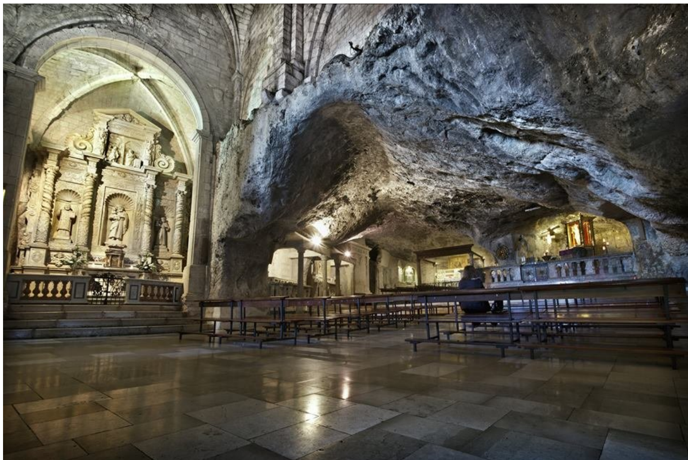
Grotta Monte Sant'Angelo - Immagine: www.italieonline.eu