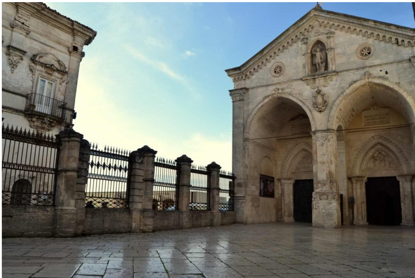
Santuario Monte Sant'Angelo