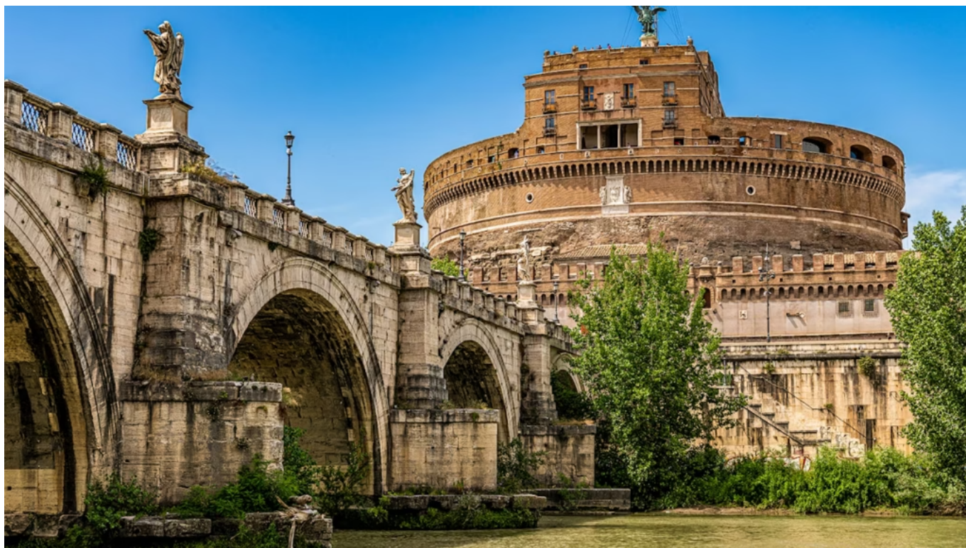
Castel Sant'Angelo Roma