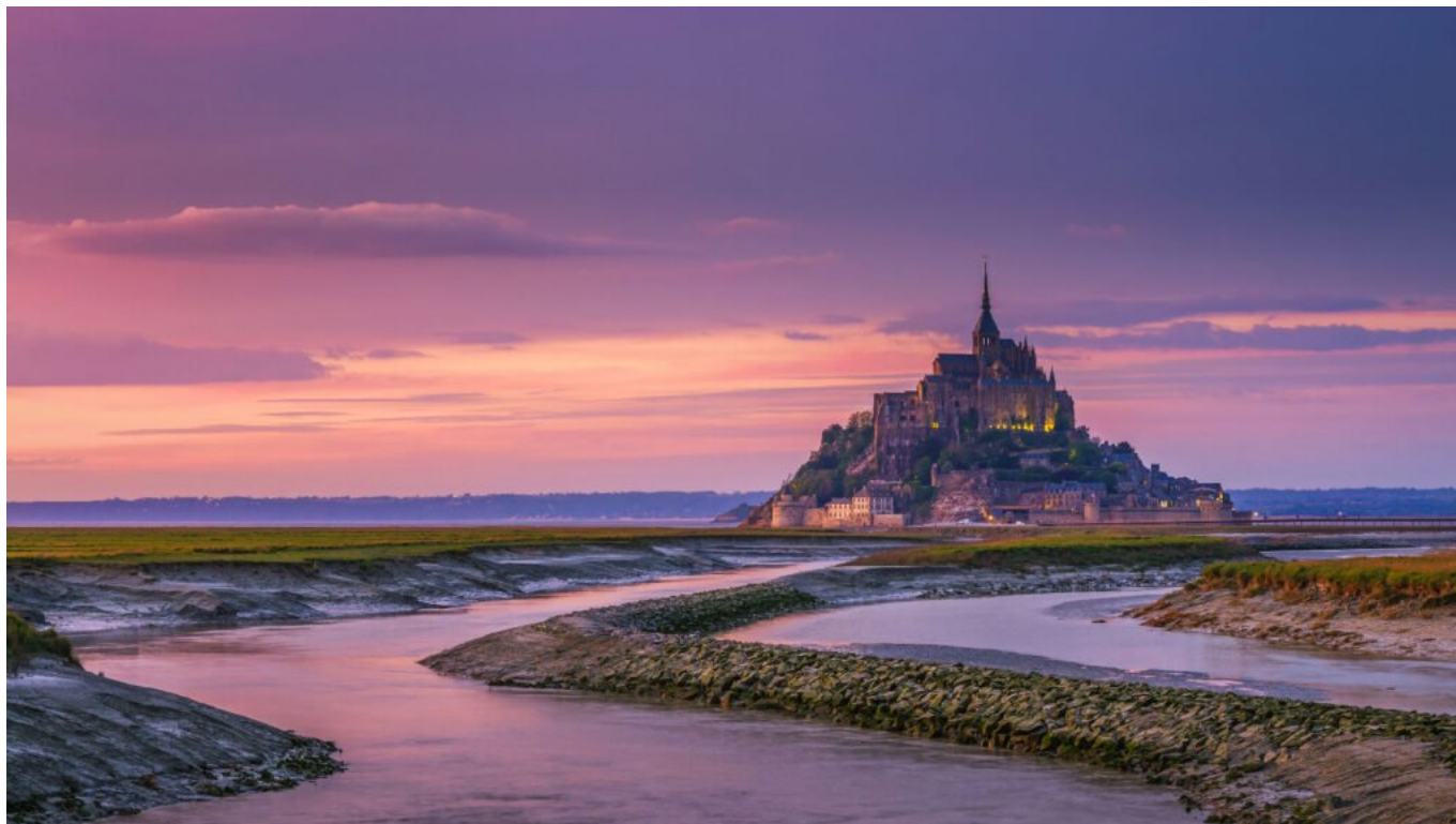
Mont Saint-Michel, Normandia, Francia.